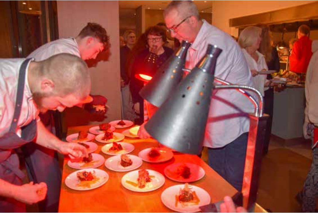
Kulinarische Genüsse in Hülle und Fülle