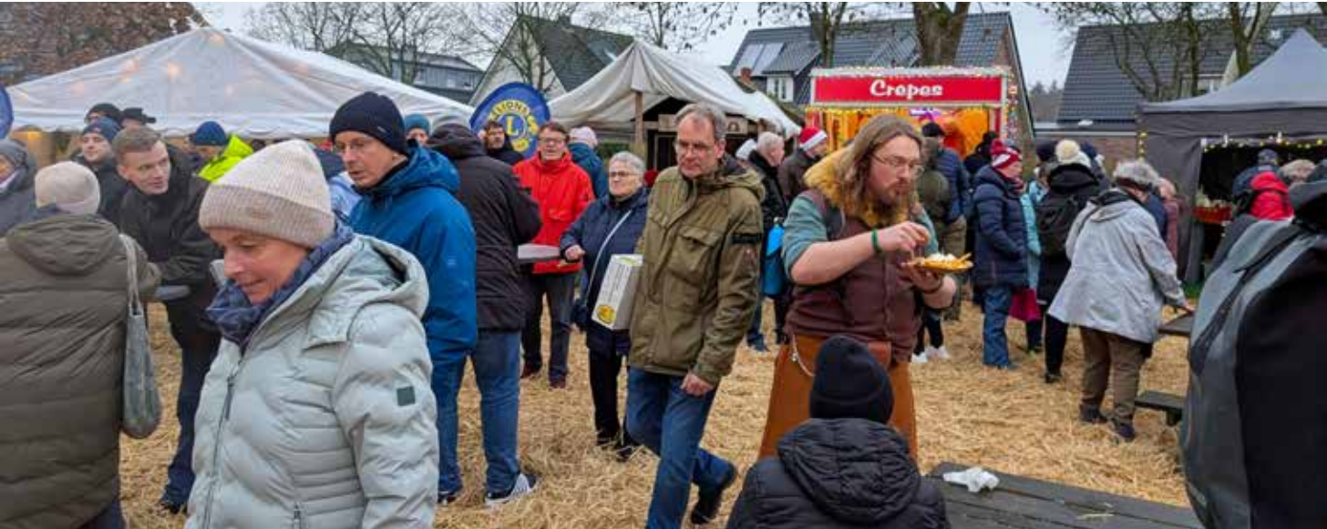
Festliche Stimmung und Kunsthandwerk im und am Friesen-Museum: