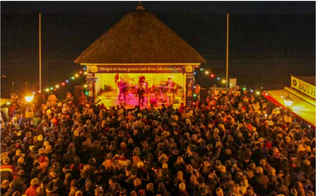
Die FTG rechnet mit bis zu 600 Besuchern auf der Open-Air-Silvesterparty auf dem Sandwall in Wyk auf Föhr

Nach dem tragischen Vorfall mit Todesfolge auf dem Jahrmarkt in Wyk auf Föhr am 18. Oktober zog die Föhr Tourismus GmbH (FTG) als Veranstalterin umgehend Konsequenzen. Sie optimierte ihre Sicherheitskonzepte für sämtliche Eigenveranstaltungen und überarbeitete die interne Krisenkommunikation. Als erste nach außen sichtbare Maßnahme hat die FTG für die bevorstehende Open-Air-Silvesterparty einen neuen Sicherheitsdienst engagiert. Über eine mögliche langfristige Zusammenarbeit mit diesem Dienstleister soll im neuen Jahr entschieden werden. »Der tragische Vorfall auf dem Jahrmarkt hat uns tief betroffen