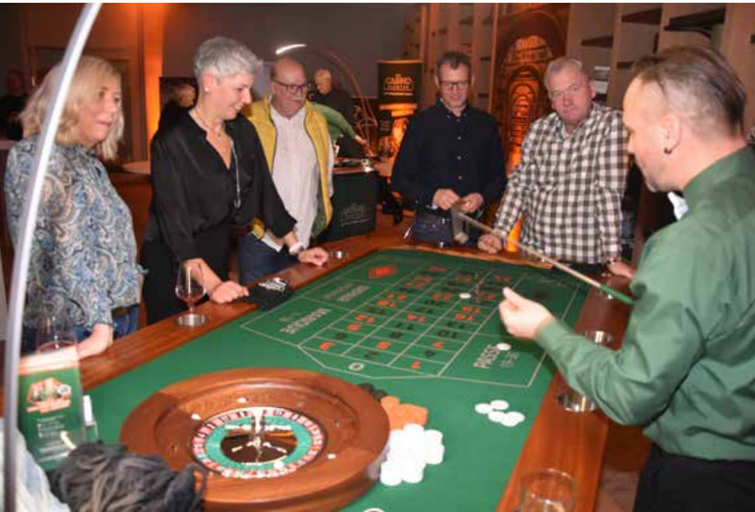
Spannende Unterhaltung beim Roulette