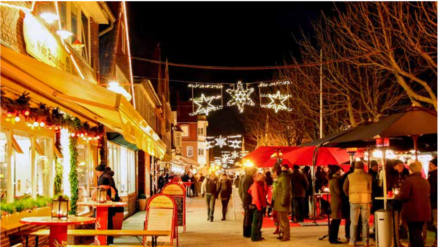
Buntes Treiben auf der Festmeile auf dem Sandwall in Wyk auf Föhr