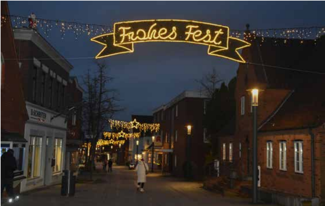
Neue Weihnachtsbeleuchtung in der Großen Straße.

Die Innenstadt von Wyk erstrahlt in diesem Jahr noch mehr in weihnachtlichem Glanz. In der Großen Straße hat die Stadt für eine ganz neue Weihnachtsbeleuchtung gesorgt, wird den Passanten gleich am Anfang in leuchtender Schrift ein »Frohes Fest« gewünscht. Auch in der Mittelstraße hat sich einiges getan. Original Herrnhuter Sterne, die sich die Geschäftsleute ausdrücklich von der Stadt Wyk gewünscht hatten, hängen jetzt an Drahtseilen über der Straße und strömen ihr warmes Licht aus. In Eigenfinanzierung hatten sich die Geschäftsleute in der Mittel- und in der Wilhelmstraße bereits zuvor Herrnhuter Sterne zur Dekoration von Geschäften, Schaufenstern und Straße angeschafft. Und auch die Weihnachtsbäume, die ihnen von der Stadt zur Verfügung gestellt werden, sind von ihnen wieder weihnachtlich geschmückt worden. Ergänzt wird das weihnachtliche Ambiente dieses Mal mit