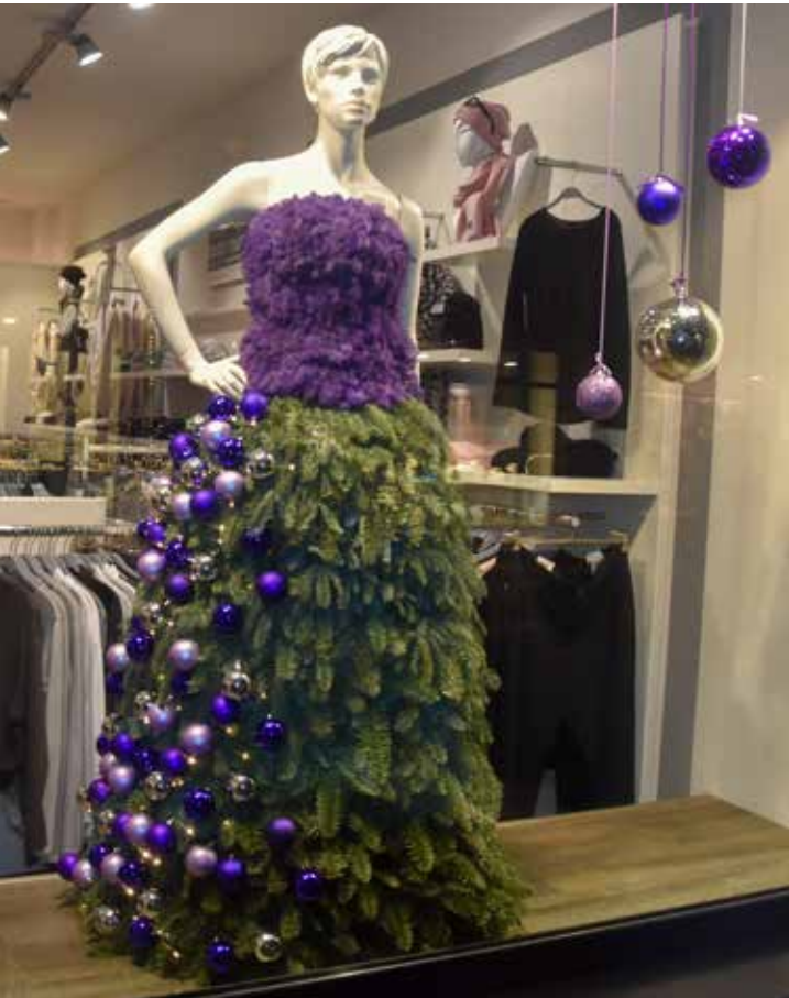
In Handarbeit entstanden: Ein Kleid aus Tannenzweigen und Weihnachtskugeln.

dekorativen Holztannen, die in der Tischlerei M. Jensen in Alkersum angefertigt wurden. Die Drahtseile wolle man über