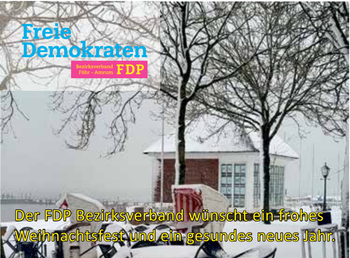
Der FDP Bezirksverband wünscht ein frohes Weihnachtsfest und ein gesundes neues Jahr.