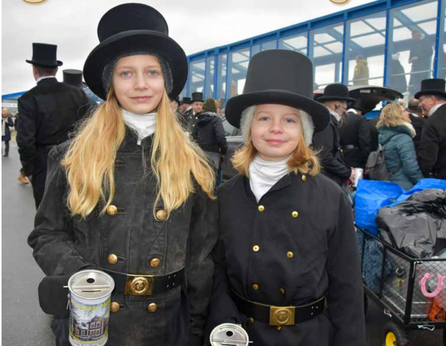
Auch der »Schornsteifegernachwuchs« kommt Silvester immer gern auf die Insel.

Frohes Fest und viel Glück im neuen Jahr