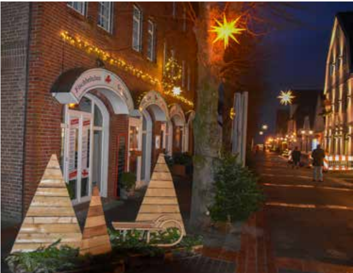
Leuchtende Sterne in der Mittelstraße