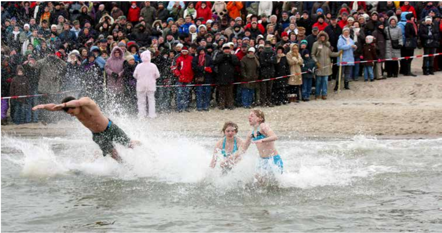
Beim Neujahrsschwimmen stürzen sich bis zu 400 Teilnehmende in die Nordsee.

für die DLRG-Ortsgruppe Insel Föhr. Tickets sind auch vorab online unter ticket.foehr.de verfügbar.