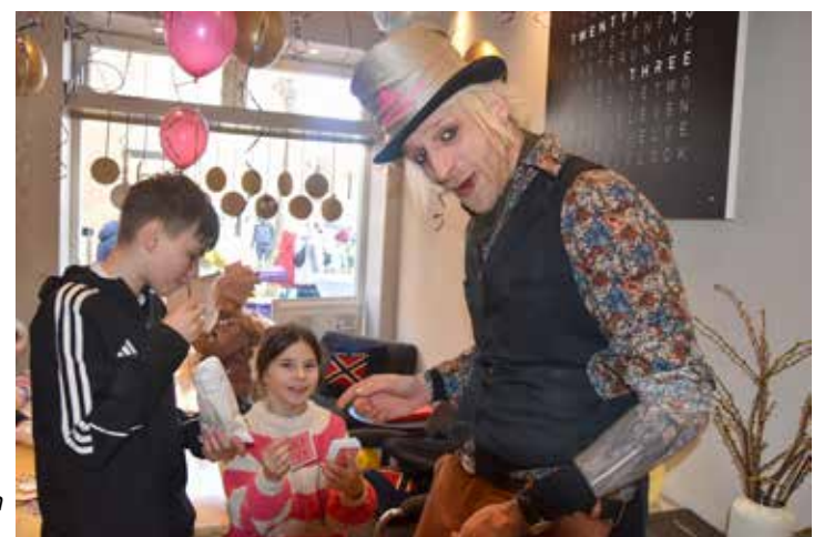
Auch die Kinder waren von den Kunststücken fasziniert.

Moin« von der Föhr Tourismus GmbH. In der Mittelstraße konnte man bei »Ranck-Wellingerhoff« dann auch dem Osterhasen persönlich begegnen. Er hatte kleine Überraschungen für die Kinder mitgebracht. In seiner Begleitung ein Zauberkünstler, der mit seinen Zauberkünsten sowohl die vielen Kinder als auch die Erwachsenen verblüffen konnte. Es gab Popcorn – und auch ein Glas Sekt, kleine Häppchen und nette Gespräche.