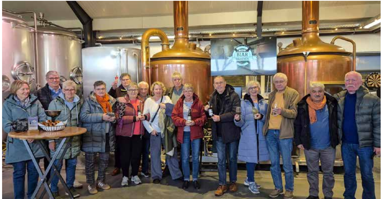
Mit Kostprobe: Ein Besuch im »Biar-Brauhüs« in Bogsum

15 von damals 26 Schülerinnen und Schülern waren noch dabei: