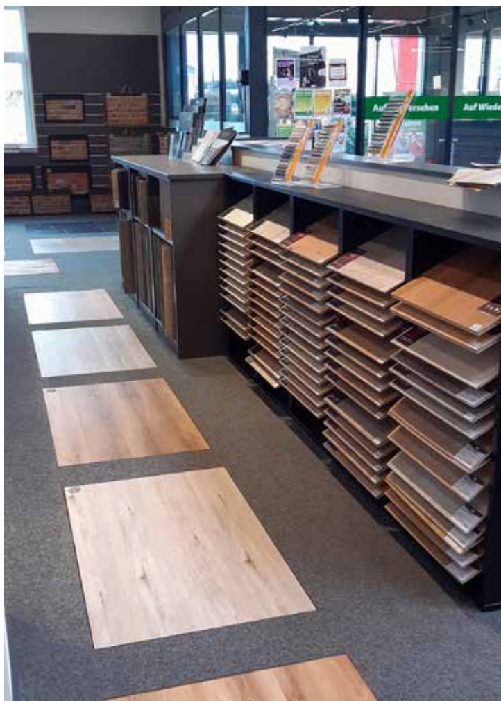
Fliesen und sonstige Bodenbeläge in der neuen Innenausstellung