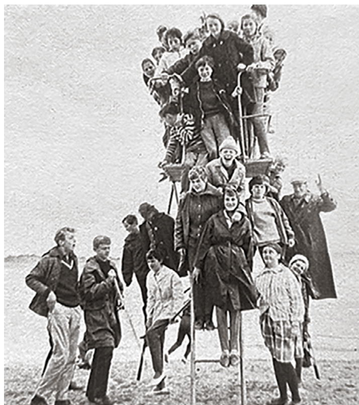
1962 die erste Klassenfahrt