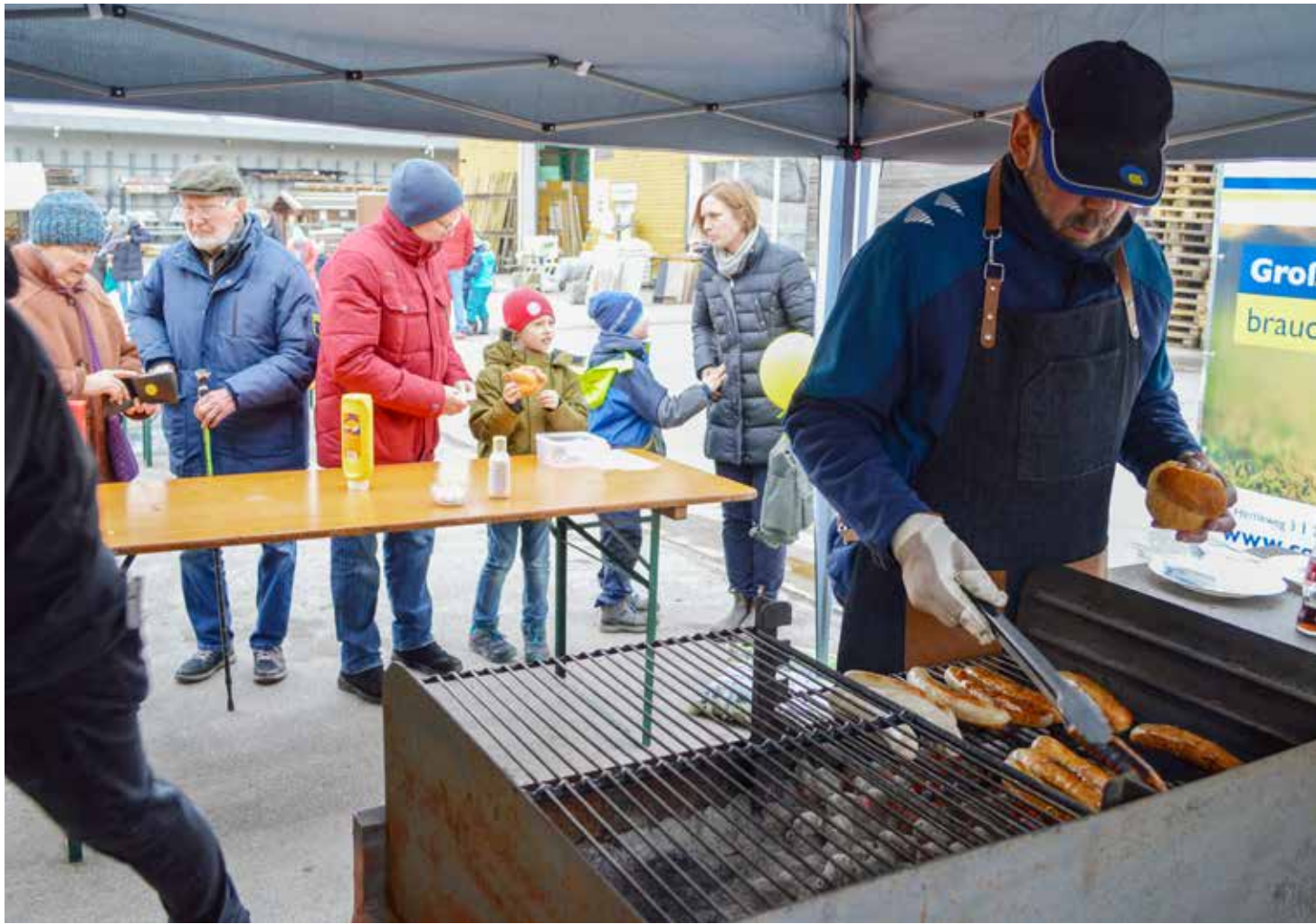
Auch dieses Mal kümmert sich ein Verein um Grillwurst und Getränke.

Nachdem alle Baumaßnahmen abgeschlossen sind und der neue »hagebau kompakt«-Baumarkt im Oktober letzten Jahres Eröffnung feiern konnte, hat die zweijährige Pause ein Ende: Am Sonnabend, 18. April, von 8 bis 14 Uhr, wird der seit Jahren beliebte Gartentag von C.G. Christiansen im Wyker Gewerbegebiet, Hemkweg 1, wieder veranstaltet. Mit den neuesten Trends rund um Haus und Garten sowie einem Programm, zu dem unter anderem eine riesige Hüpfburg, eine Schminkecke und Waffeln für die Kinder gehören. Wobei ein netter Klönschnack hier und da nicht fehlen darf. Und mit kühlen Getränken und der obligatorischen Grillwurst ist auch fürs leibliche Wohl gesorgt. Nicht zu vergessen die große Tombola des Vereins Borigsem Oterbaankin, bei der es