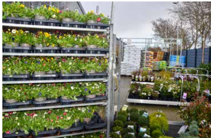
Ein Meer an blühenden Pflanzen

Die Bewirtung übernimmt wie immer ein Föhrer Verein zugunsten der Vereinskasse. Dieses Mal ist es der Kleingärtnerverein. Die Vereinsmitglieder stehen aber nicht nur am Grill und sind für die Getränke zuständig. Sie geben außerdem wertvolle Tipps zur Gartenarbeit und -pflege. Womit auch dieser Gartentag wieder für viele Informationen steht – und ebenfalls Unterhaltung bietet.