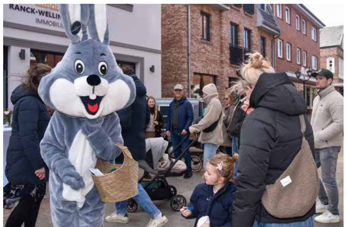
Nanu, ist das nicht der Osterhase?

Buntes Treiben am Ostersonntag in der Wyker Innenstadt: Immer wieder Kinder und Eltern, die Teilnahmekarten in den Händen hielten, sich an der Osterei(s)-Rallye von »SUP Island« beteiligten und in den Schaufenstern der Geschäfte konzentriert nach Teilen der diesjährigen Lösung suchten. Der Lohn dafür war für die Kinder eine Kugel Eis vom »Eiscafé Sandwall« und ein kühles Bier für die Erwachsenen. Und an der Musikmuschel anschließend eine Mini-Disco mit »Maik-