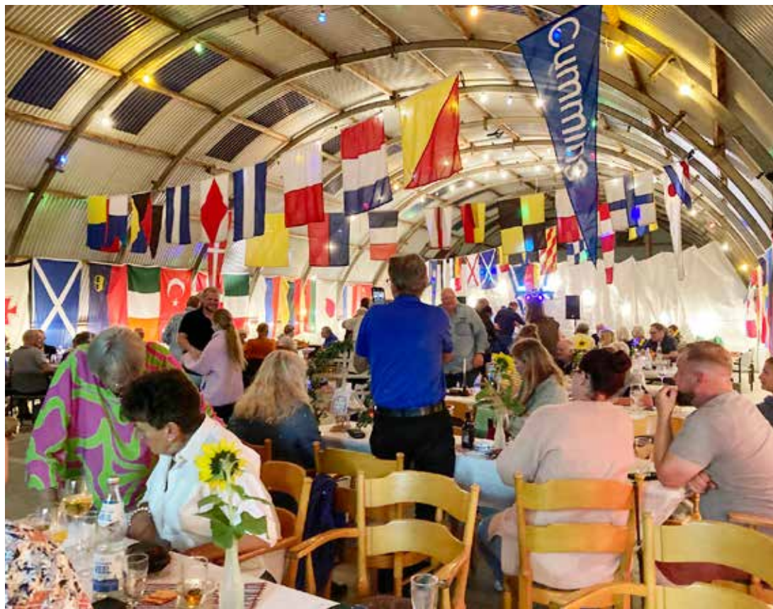
Das Sommerfest in der Bootshalle ist einer der Höhepunkte des Jahres.

und der Liveband »Emotion« wurde am 7. März in »Krögers Dörpskrog« in Oevenum das 50-jährige Jubiläum gefeiert.