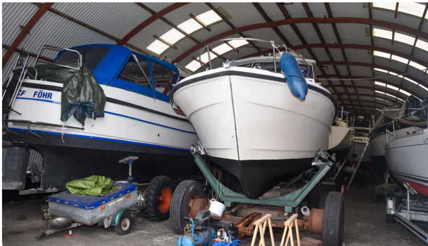
Im Winter sind sie alle belegt: Die Plätze in den zwei Bootshallen.