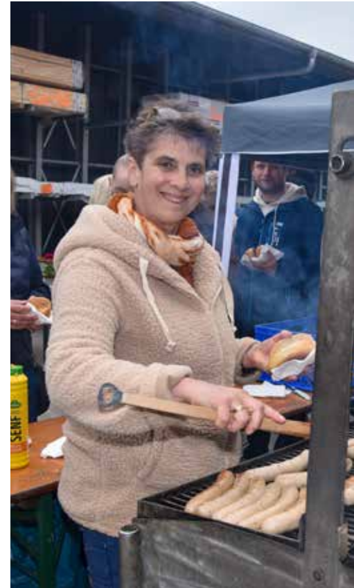
Heiß begehrt: Die Grillwurst im Brötchen