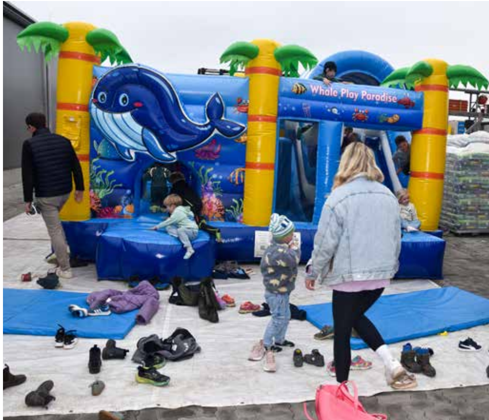
Ausgelassenes Toben auf der Hüpfburg