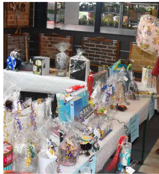
Tombola des Vereins Borigsem Oterbaankin: Viele tolle Preise