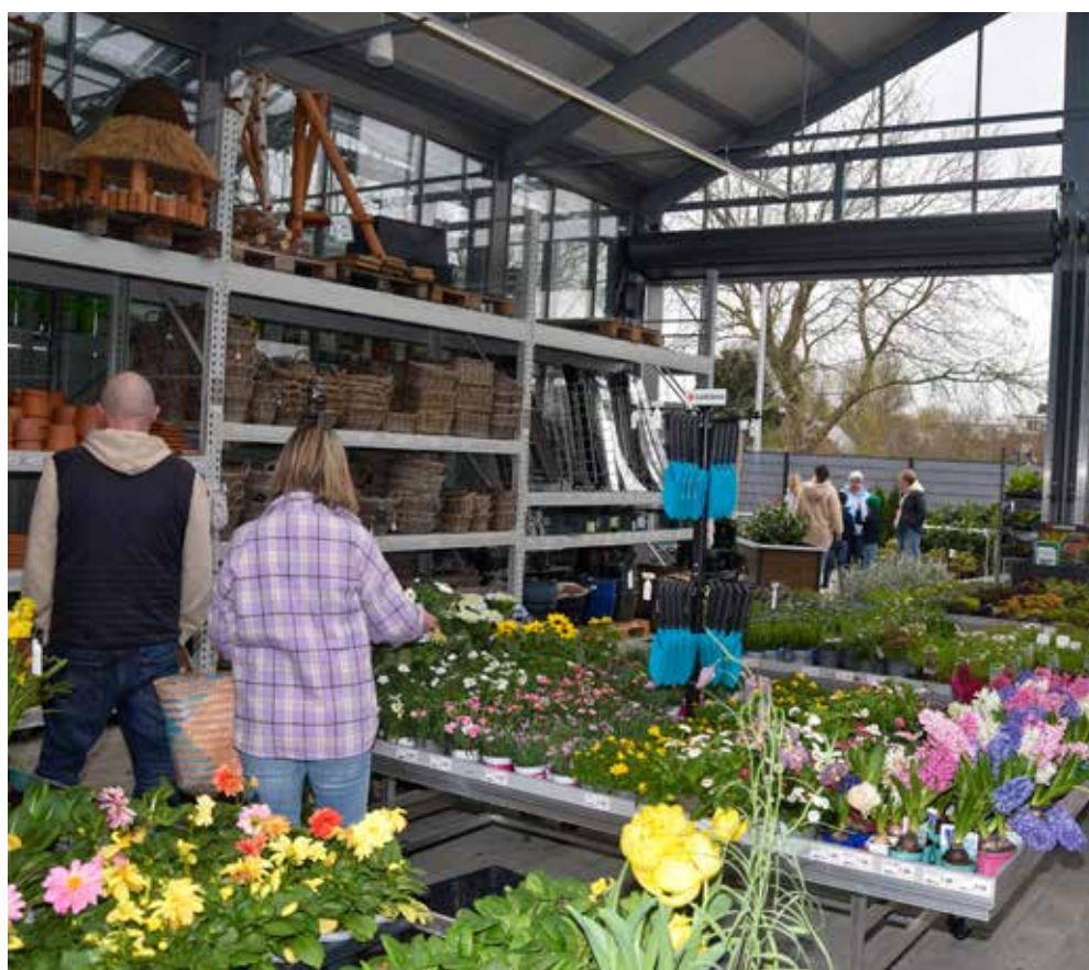
Blühendes durfte am Gartentag natürlich auch nicht fehlen