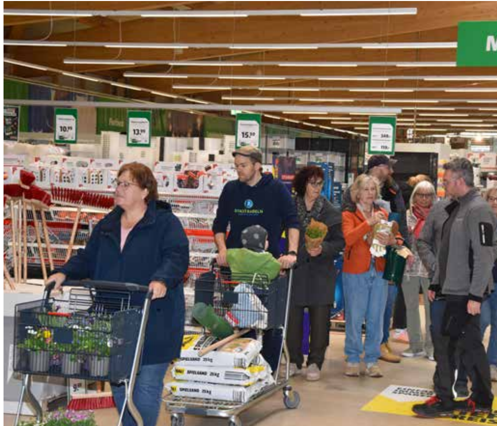
Am Gartentag was es fast so voll wie zur Neueröffnung des Baumarkts im Oktober.