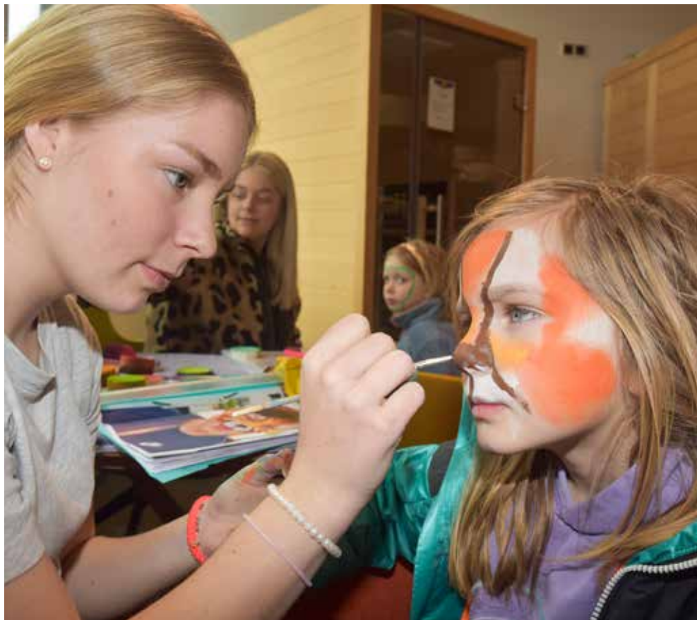
Wie immer gut angekommen: Das Kinderschminken

Inselfahrten · Kurierfahrten · Festlandfahrten Krankenfahrten für alle Kassen – bundesweit (Dialyse-, Chemo- und Bestrahlungsfahrten)