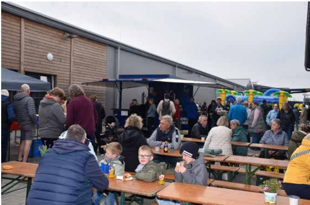
Kleine Pause zwischen Beratung und Einkauf