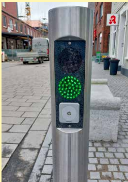
Standsäule der Polleranlage in der Königstraße

cherheitsrisiko oder als Fehlfunktion erkannt und entsprechend blockiert. Zum 1. Mai wird somit das Absenken der Polleranlage per Anruf über das Mobiltelefon nicht mehr funktionieren. Die Nutzung des Handsenders zur Ansteuerung der Anlage bleibt weiterhin uneingeschränkt möglich. Als Alternative kann die Polleranlage über die »MOBIPASS-Funktion« der »My Intratone-App« von einem 4G-fähigen Handy weiterhin gesteuert werden. Hierfür ist es erforderlich, die App zu installieren und die beim Ordnungsamt registrierte Rufnummer zu hinterlegen.