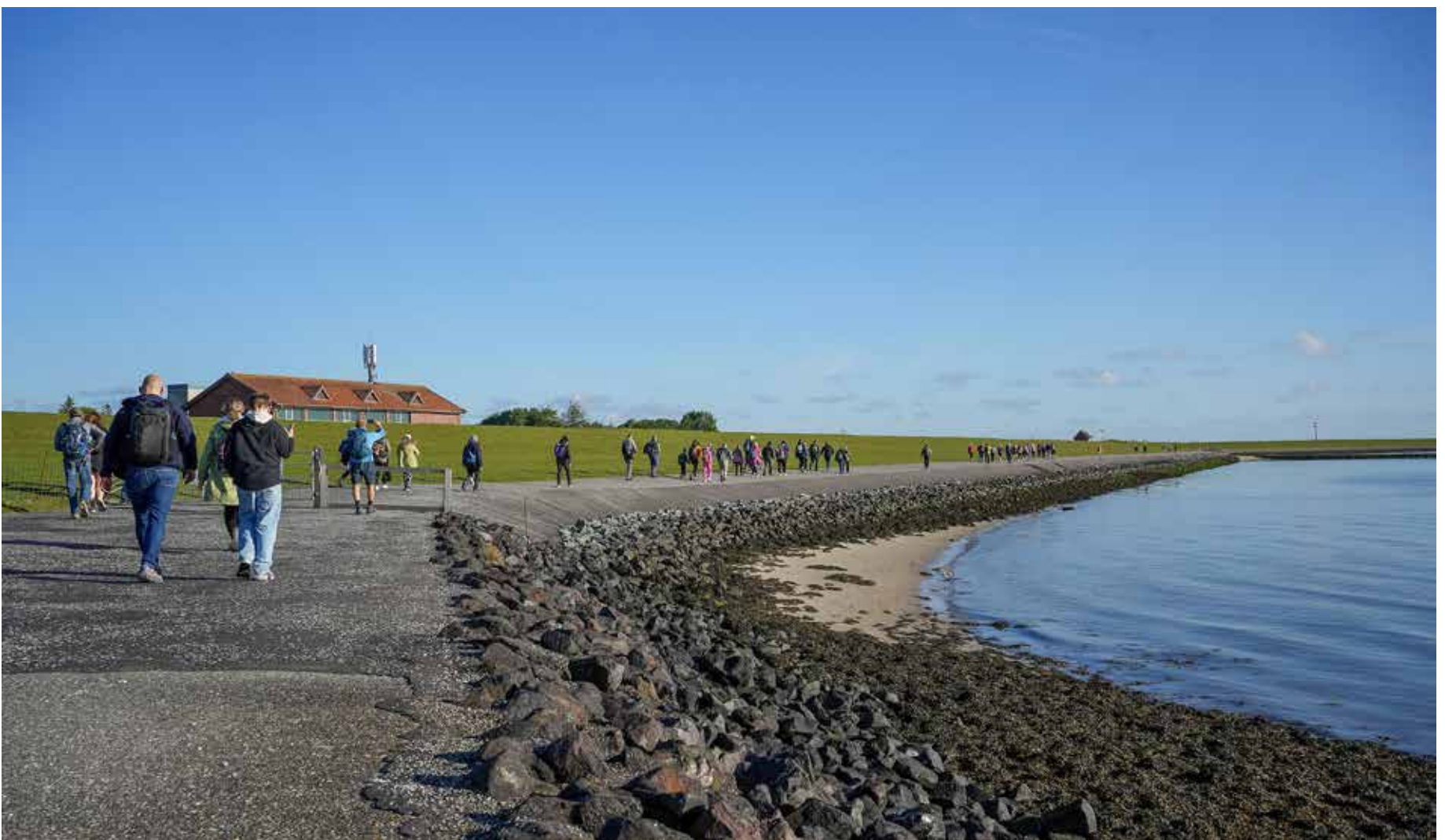
Rund um Föhr sind es etwa 38 Kilometer.

Es gibt eine ganze Reihe von Inseltraditionen, die bis heute bewahrt wurden und lebendig sind. Dazu gehört auch Rund-Föhr am Himmelfahrtstag: An diesem Tag gehen die Insulanerinnen und Insulaner – ausgestattet mit einer Thermoskanne Tee oder Kaffee sowie Broten – auf dem Deich und am Strand entlang rund um ihre Insel. Das