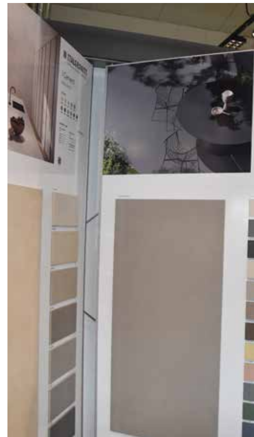
»Im Trend liegen Fliesen, die immer größer werden