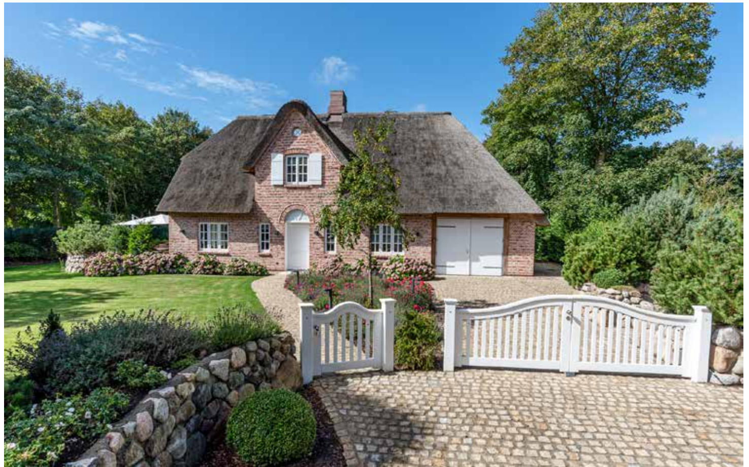
Das neue Traumhaus in Utersum, das man jetzt gewinnen kann.