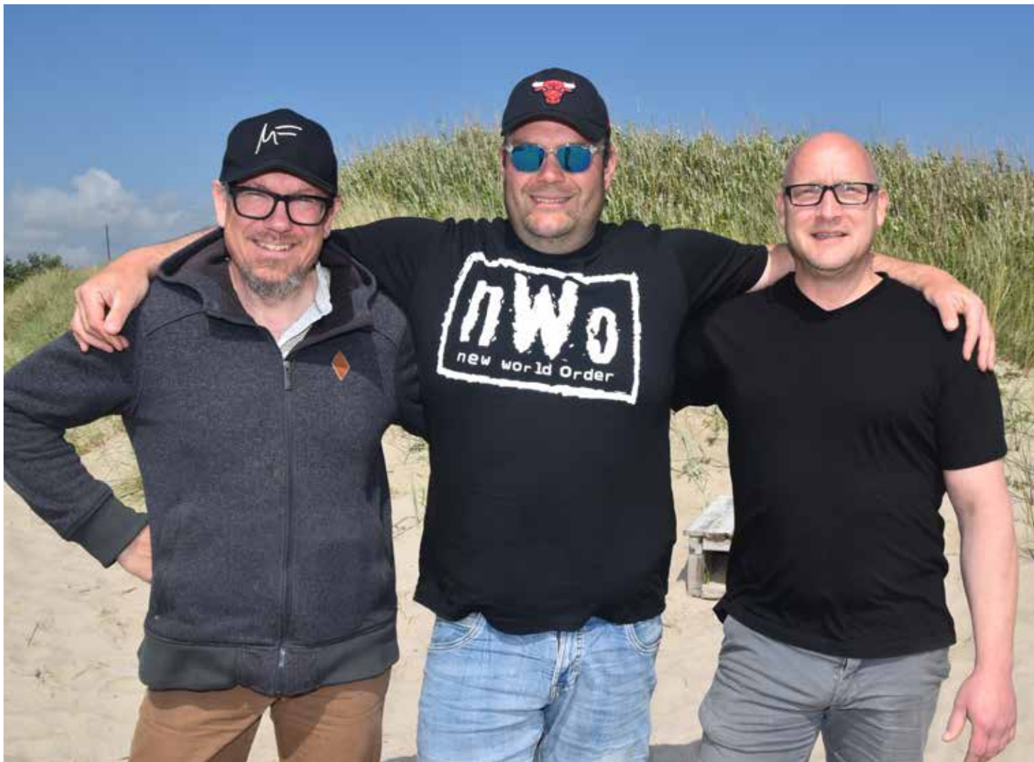
Die Initiatoren am Nieblumer Strand, wo das Event dieses Mal auf dem Gelände der Nieblumer Wassersportschule stattfindet.