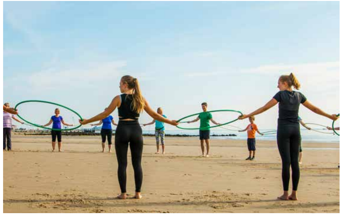
Strandgymnastik auf Föhr

Auch am Strand in Utersum wird wieder gemeinsam trainiert: Dort startete die Strandgymnastik bereits am 2. Juni und findet bis zum 15. September jeweils dienstags und freitags statt. Treffpunkt ist um 8.15 Uhr am DLRG-Turm am Badestrand.