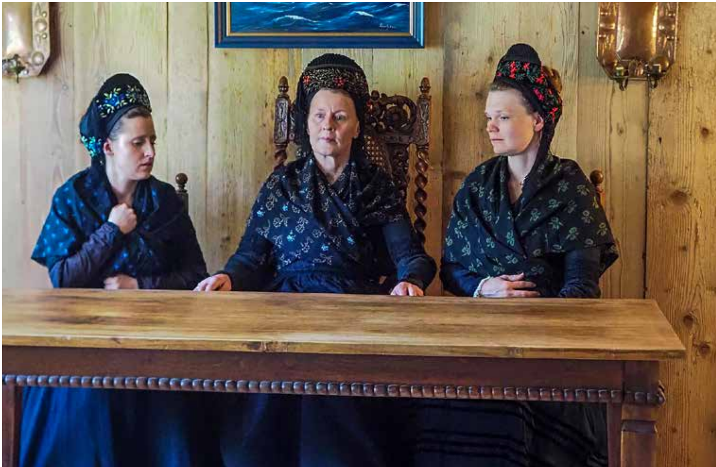
Szene aus »Die Frauen der Mary Celeste – das Geheimnis des Geisterschiffes«