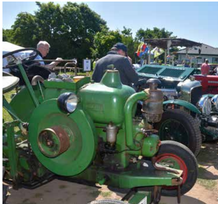
Auch der Föhrer Oldtimer-Club war wieder dabei.

Mit uns sprechen Tel.: 04681 | 980 923 - 0 Mail: info@alternativtechnik.de Web: www.alternativtechnik.de