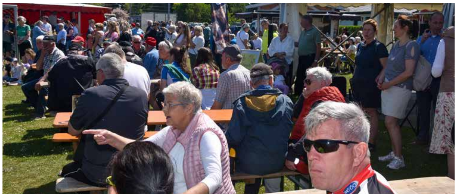
Den ganzen Tag über viele Besucher

Koogskuhl 12 · Wyk Tel. 04681 586360 www.autohaus-foehr.de