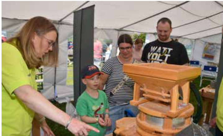
Ein junger Besucher beim Müller-Diplom