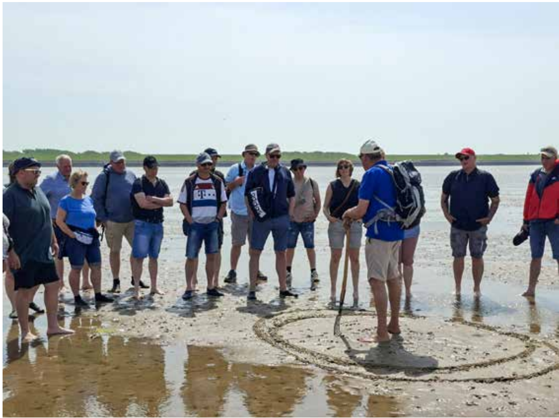
Der Mitteldörper Ringreiterverein hatte zur Wattwanderung eingeladen.

Für die Ringreiter und Ringreiterinnen hat die Saison begonnen: Die Landjugend veranstaltete das erste Ringreiten dieses Jahres in Oevenum. Zuvor gab es noch eine naturkundliche Wattwanderung, zu der der Mitteldörper Ringreiterverein eingeladen hatte und die zu einem vollen Erfolg wurde. Nachdem die Winterversammlungen und