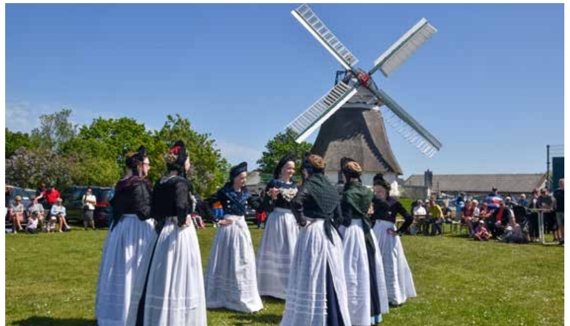
Mühle und Trachten: Das passt!