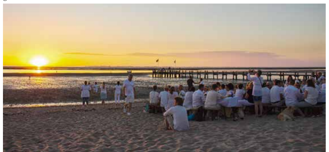
Teilnehmer des White Dinners am Utersumer Strand

und eine Anmeldung nicht erforderlich. Bei schlechtem Wetter wird die Veranstaltung samt Konzert in die Strandkorbhalle verlegt. Weitere Informationen sind unter foehr.de/white-dinner zu finden.