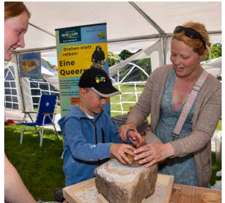
So wird Mehl gemahlen.